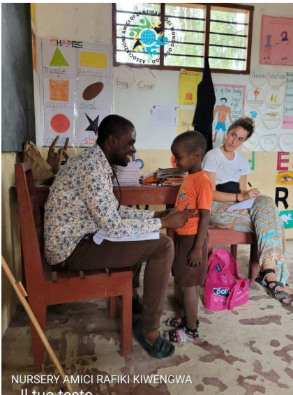
NURSERY AMICI RAFIKI KIWENGWA Il tuo testo