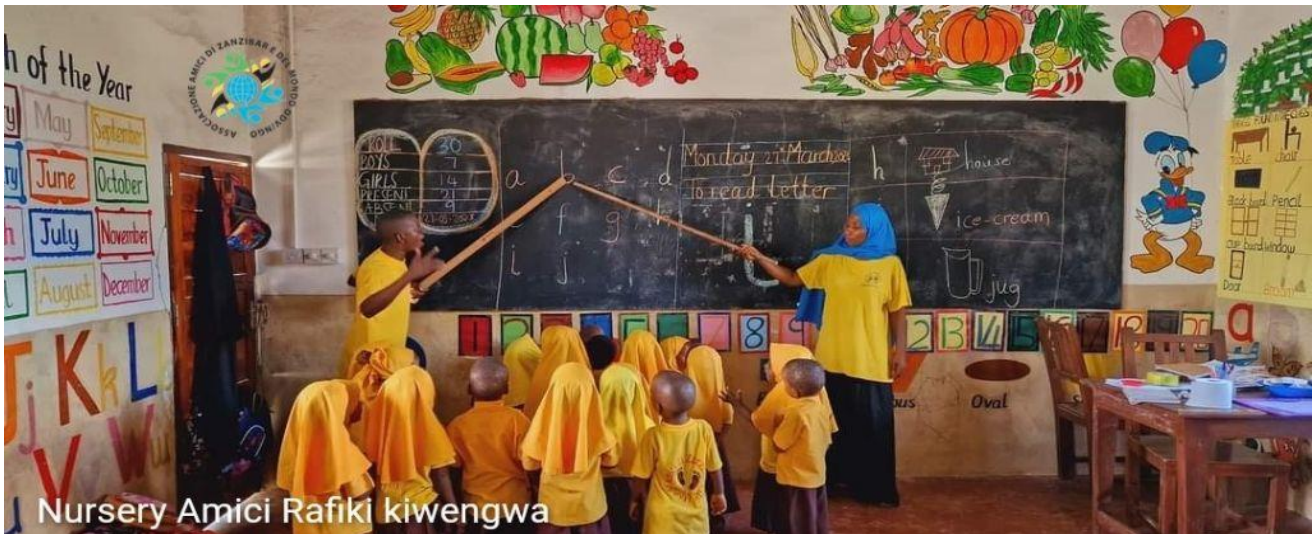
Nursery Amici Rafiki kiwengwa

Associazione "Amici di Zanzibar e del Mondo ODV" Via Lago Di Como ,18--58100 Grosseto-Italy Mobile. +39393 3098863 --C.F. 920 88320533 Web site: www.amicidizanzibaredelmondo.org E-mail: info@amicidizanzibaredelmondo.org Facebook - Instagram: amicidizanzibaredelmondodv Pec: amicidizanzibaredelmondo@pcert.postecert.it