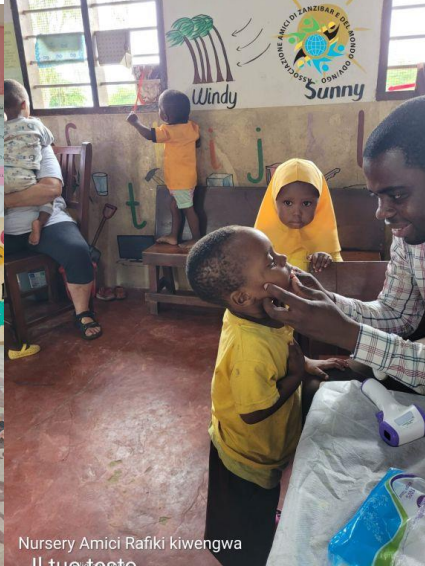
Nursery Amici Rafiki kiwengwa Il tuo testo